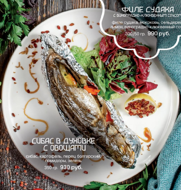
СИБАС В ДУХОВКЕ С ОВОЩАМИ сibas, картофель, перец болгарский, помидоры, зелень 350 гр. 930 руб.