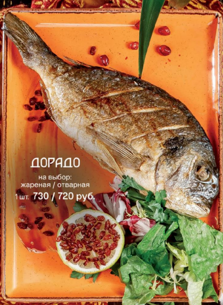
ДОРАДО на выбор: жареная / отварная 1 шт. 730 / 720 руб.