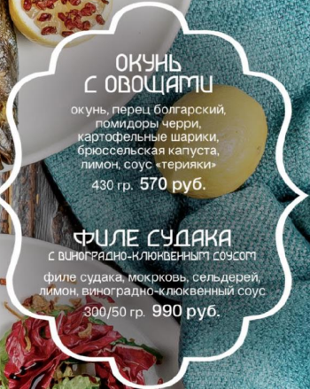
ОКУНЬ С ОВОЩАМИ окунь, перец болгарский, помидоры черри, картофельные шарики, брюссельская капуста, лимон, соус «терияки» 430 гр. 570 руб.