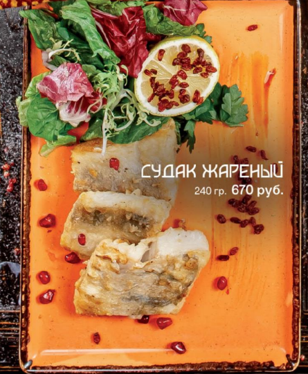
СУДАК ЖАРЕНЫЙ 240 гр. 670 руб.