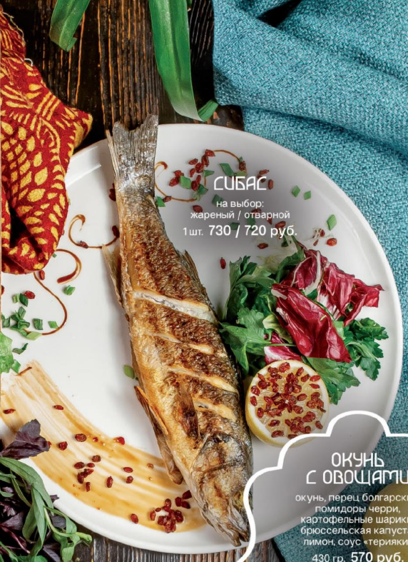
СИБАС на выбор: жареный / отварной 1 шт. 730 / 720 руб.