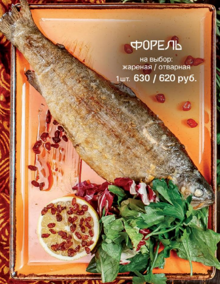
ФОРЕЛЬ на выбор: жареная / отварная 1 шт. 630 / 620 руб.