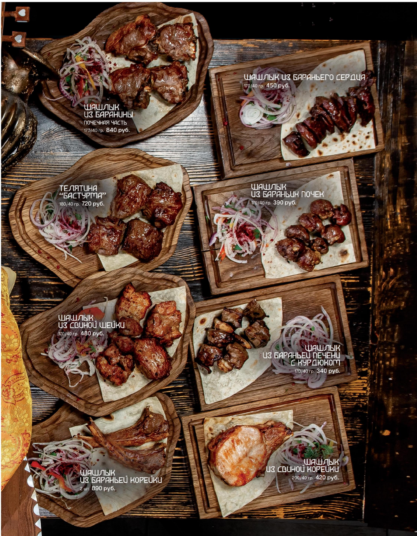
ШАШЛЫК ИЗ БАРАНИНЫ ПОЧЕЧНАЯ ЧАСТЬ 170/40 гр. 840 руб.